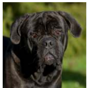
Massif, le cane corso ! ■ PHN

Si on ne dispose pas de statistiques sur les chiens méchants abattus ou euthanasiés en Belgique, selon plusieurs grandes zones de police, les cas sont plutôt rares. Tant à Liège qu'à Charleroi, c'est la brigade canine qui traite les cas de chiens dangereux, la plupart du temps après morsures.